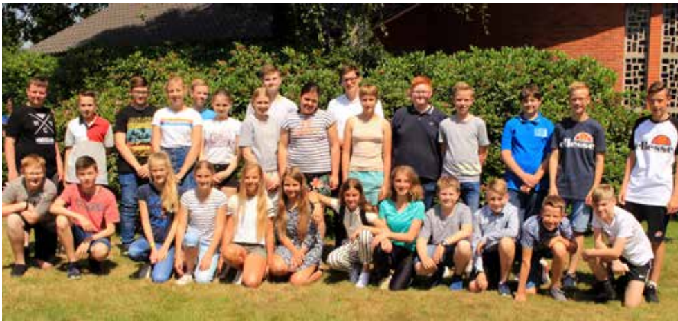
Konfirmanden Katharina-Kirche, 26.04.2020