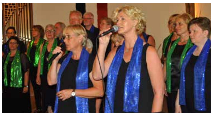
Joyful Harmony - der Gospelchor aus Bad Zwischenahn